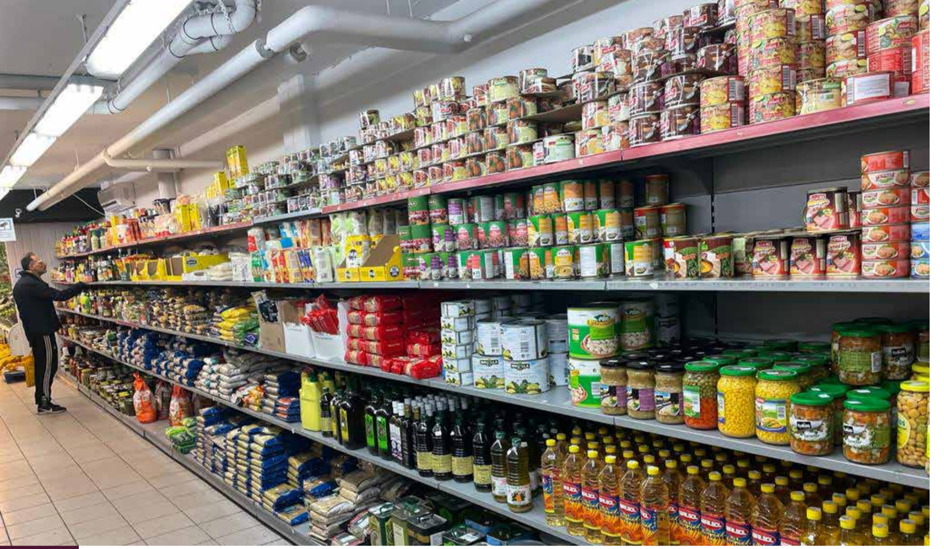
يأتي رمضان هذه السنة مع موجة غلاء في المواد الغذائية