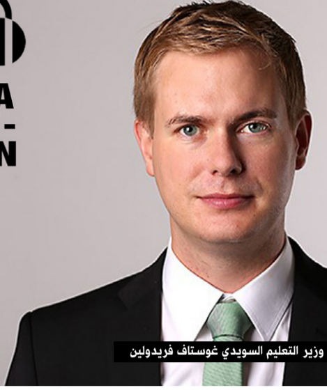
وزير التعليم السويدي غوستاف فريدولين