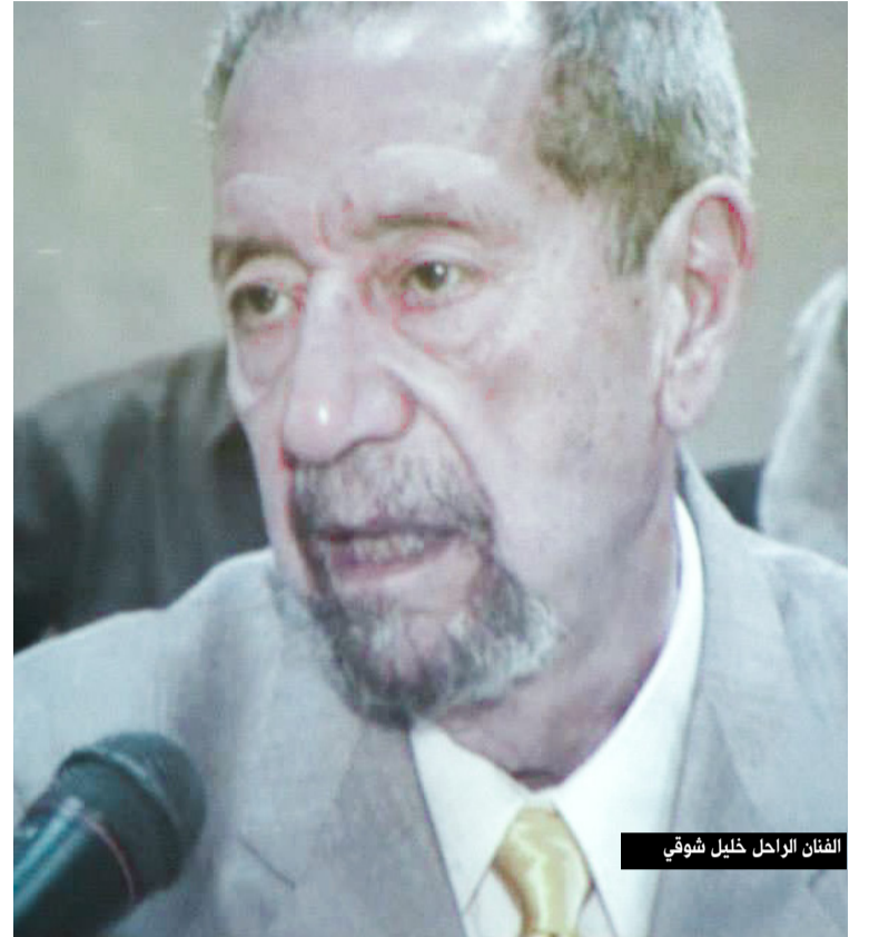
الفنان الراحل خليل شوقي