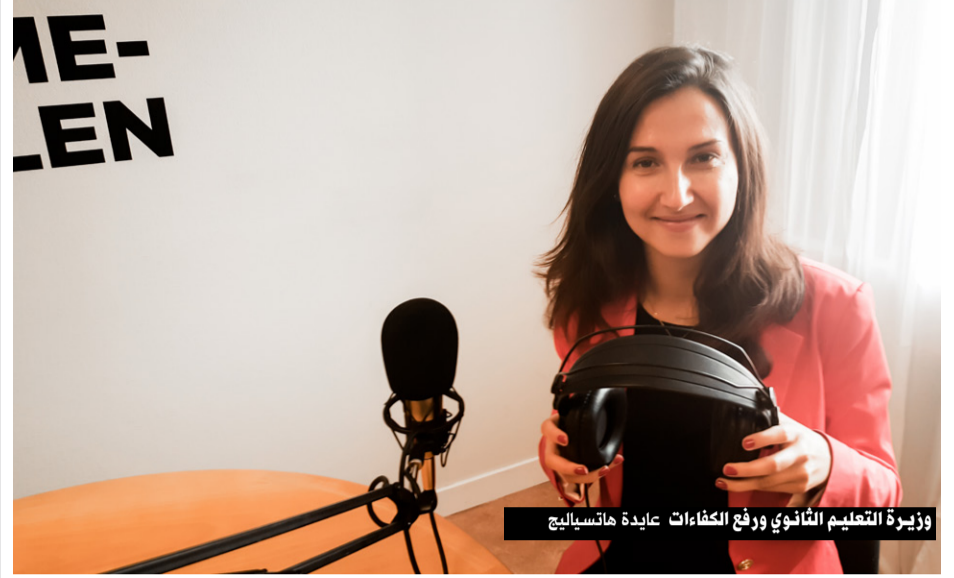
وزيرة التعليم الثانوي ورفع الكفاءات عايدة هاتسجالج