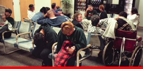
مجلس الخدمات الاجتماعية يوضح أسباب طول فترات انتظار المرضى للحصول على الرعاية الطبية ص 15