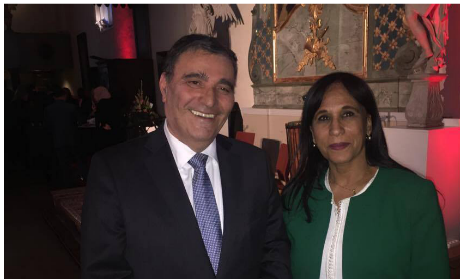
سفيرة المملكة المغربية في السويد أمينة بو عياش مع السفير الجزائري فتاح محرز