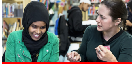
أهم الأسئلة الشائعة التي تصل للصليب الأحمر من اللاجئين وطالبي اللجوء ص 8