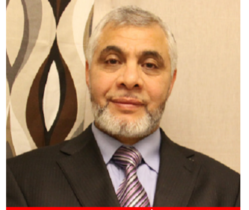
رئيس المركز الإسلامي في السويد للكومبيس:

نحن مؤسسات إسلامية سويدية لا نتبع للإخوان ولا لغيرهم ص 6