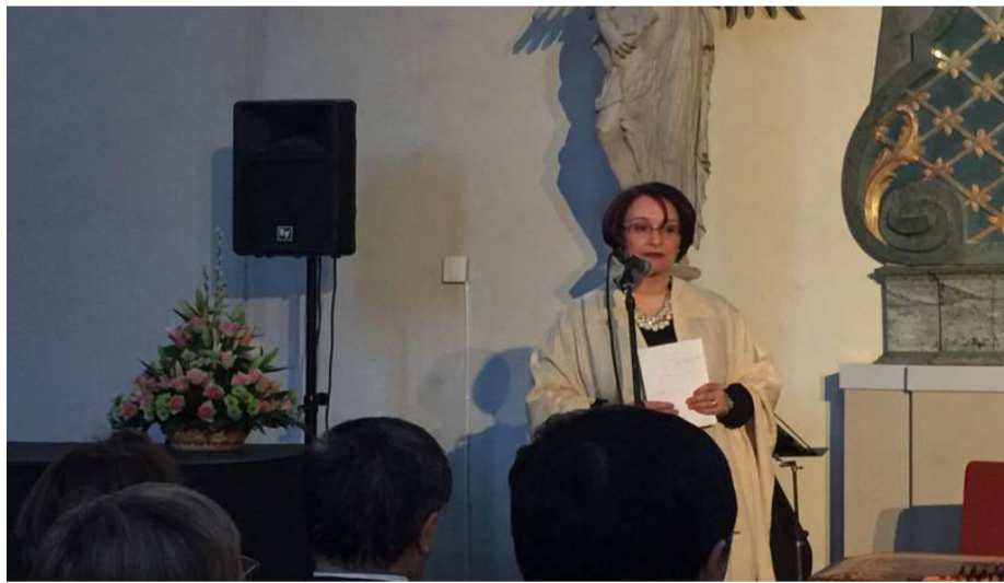
السفيرة التونسية في ستوكهولم فاطمة عمراني