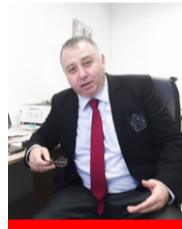
رئيس تحرير شبكة الكومبيس الإعلامية

هذه دعوة لجميع الجمعيات والاتحادات في السويد الناطقة بالعربية، من الكومبيس للتواصل مع الإعلام، مع استعدادنا إلى تنظيم دورات للتعامل مع وسائل الإعلام بطريقة احترافية مبسطة، وإقامة حلقات نقاش وحوار لما فيه مصلحة الجميع، وللحفاظ على أمن المجتمع.