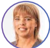
LONE - SECRETARY