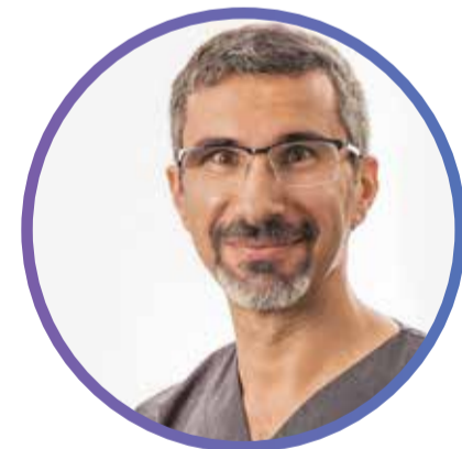
BAHIR - SURGEON

دكتوراه في جراحة المعدة والأمعاء من كوبنهاجن.