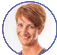
MIA - NURSE