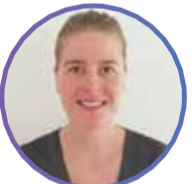
NANNA - NURSE