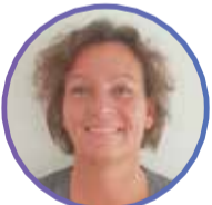
PIA - NURSE