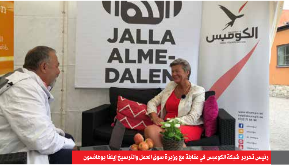
رئيس تحرير شبكة الكومبس في مقابلة مع وزيرة سوق العمل والتوسيع إيلفا يوهانسون