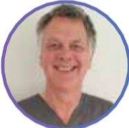
STEEN - SURGEON