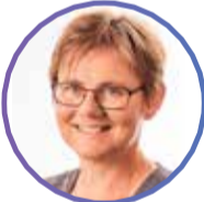
MAI-BRITT - NURSE