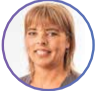
LONE - SECRETARY