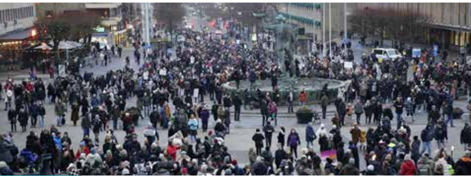
Björn Larsson Rosvall / TT

22 يناير: مدينتا ستوكهولم ويوتبوري تشهدان مظاهرات مناهضة لتصاريح كورونا أو ما يعرف بجواز سفر كورونا ورفضاً للتطعيم. حيث حمل المتظاهرون شعارات تندد بذلك. وكتبت على لافتات المتظاهرين عبارة "لا للتلقيح" و "لا تلمسوا أطفالنا"