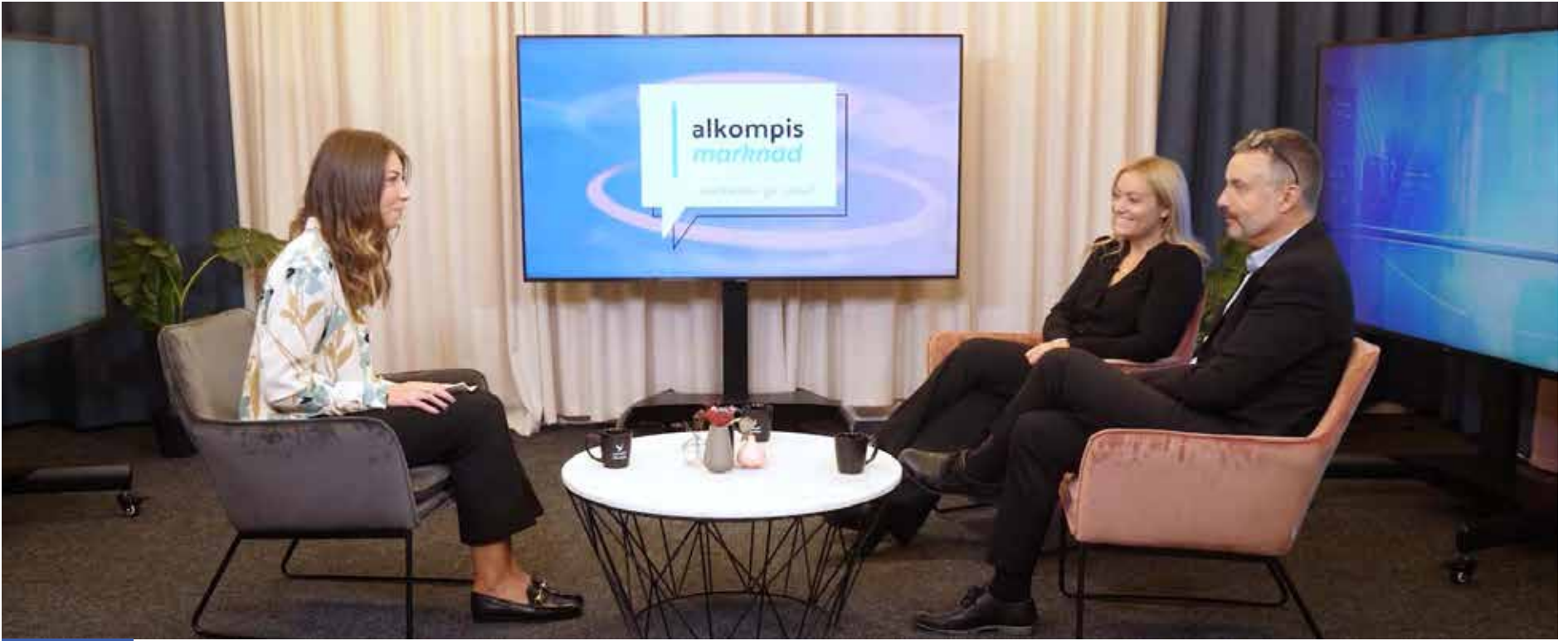
الكومبس ماركناد، تستضيف شركة سويدية طورت برنامج INBooks وترجمته إلى العربية، لإزالة هذه العقبة المهمة